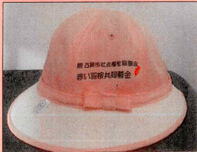
新入生の交通安全帽