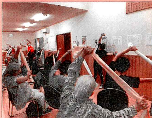
福祉会のサロン活動